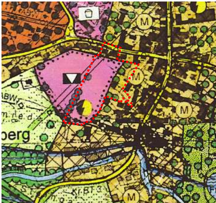
Auszug aus FNP des Marktes Weidenberg mit Geltungsbereich B-Plan

Das Plangebiet wird im wirksamen Flächennutzungsplan der Marktgemeinde Weidenberg als „gemischte Bauflächen“ und als Fläche für den Gemeinbedarf dargestellt. Die Gemeinbedarfsfläche ist näher bestimmt für Kulturellen Zwecken dienenden Einrichtungen und Gebäuden.